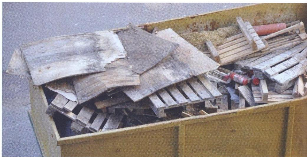
Här är många sköna hundralappar på väg att gå upp i rök.

fanns inget returssystem för sådana. Bristen på fungerande system gjorde att stora mängder pall slängdes.