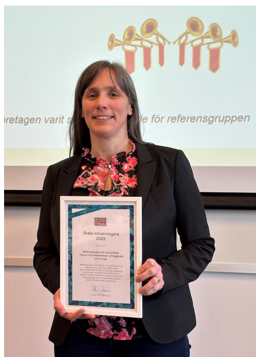
Elisabet Höglund tog emot utmärkelsen Årets Initiativtagare.